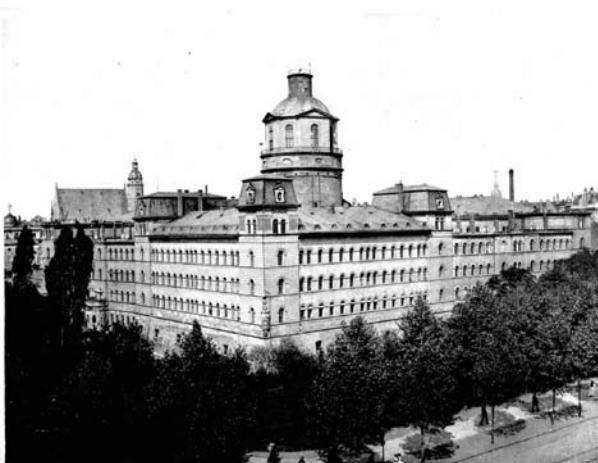
Pleißenburg um 1880