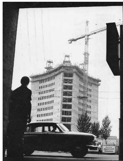
Universitäts-hochhaus im Bau 1969